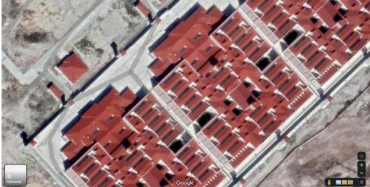
Ereğli Y-Typ-Gefängnisse Nr. 1 und Nr. 2