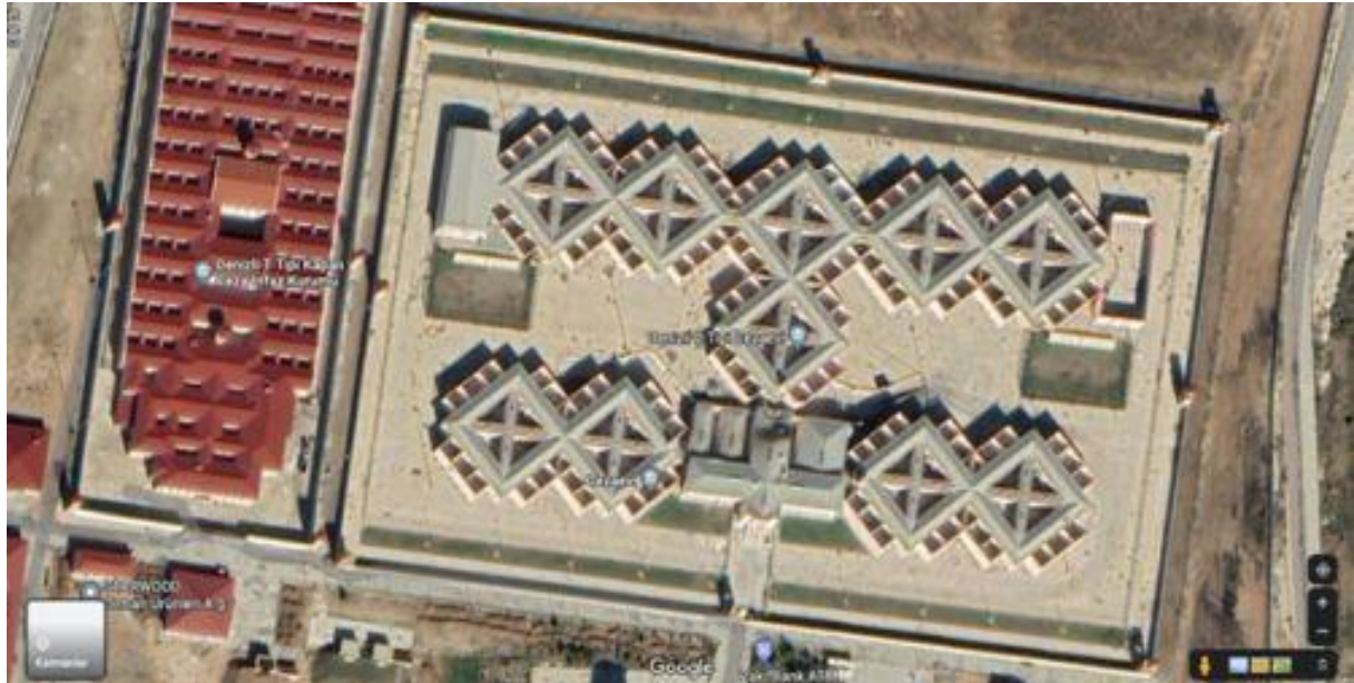
D-Typ-Geschlossene Strafvollzugsanstalt Denizli

Wie im untenstehenden Bild zu sehen ist, gehören die D-Typ-Gefängnisse architektonisch zu den auffälligsten und eigenständigsten Bauformen innerhalb des türkischen Gefängnissystems.