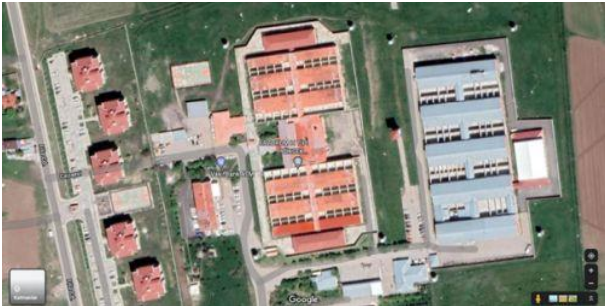
H-Typ-Hochsicherheits-Geschlossene Strafvollzugsanstalt Erzurum