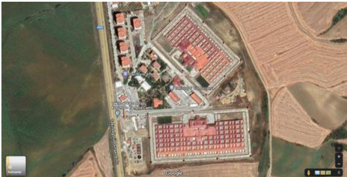
Tekirdağ F-Typ-Hochsicherheits-Geschlossene Strafvollzugsanstalten Nr. 1 und 2

Es handelt sich um nach dem sogenannten “Raumsystem” errichtete Gefängnisse, die aus Ein- und Drei-Personen-Zellen bestehen. In einer Standard-F-Typ-Strafvollzugsanstalt gibt es 103 Dreipersonenzellen und 59 Einzelzellen. Während die Einzelzellen einstöckig und 10 m 2 groß sind, sind die Dreipersonenzellen zweistöckig. iii