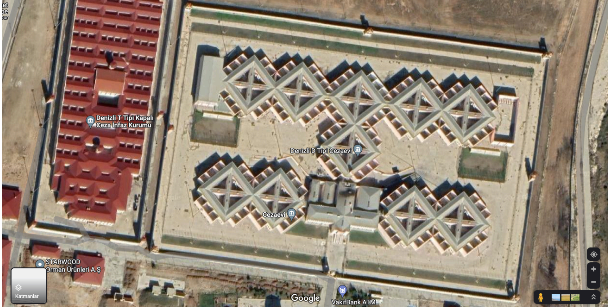
Denizli D Tipi Kapalı Ceza İnfaz Kurumu