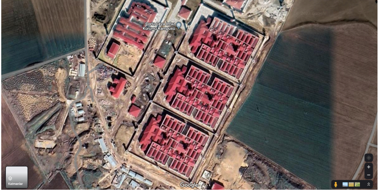
Çorlu Ceza İnfaz Kurumları Kampüsü

Bu hapishanelerin mimarisi, dışarıdan bakıldığında Y Tipi hapishanelerin mimarisiyle aynı gözükmemektedir. Aşağıdaki iki fotoğraf bunu açıkça göstermektedir.