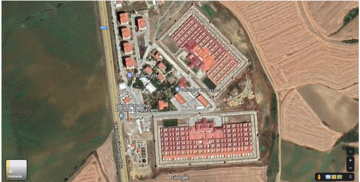
Tekirdağ 1 ve 2 Nolu F Tipi Yüksek Güvenlikli Kapalı Ceza İnfaz Kurumu

1 ve 3 kişilik hücrelerden oluşan, "oda sistemi"ne göre inşa edilmiş hapisanelerdir. Standart bir F Tipi hapisanede 103 adet 3 kişilik ve 59 adet 1 kişilik hücre bulunmaktadır. 1 kişilik hücreler tek katlı ve 10 m2 iken 3 kişilik hücreler iki katlıdır. 3