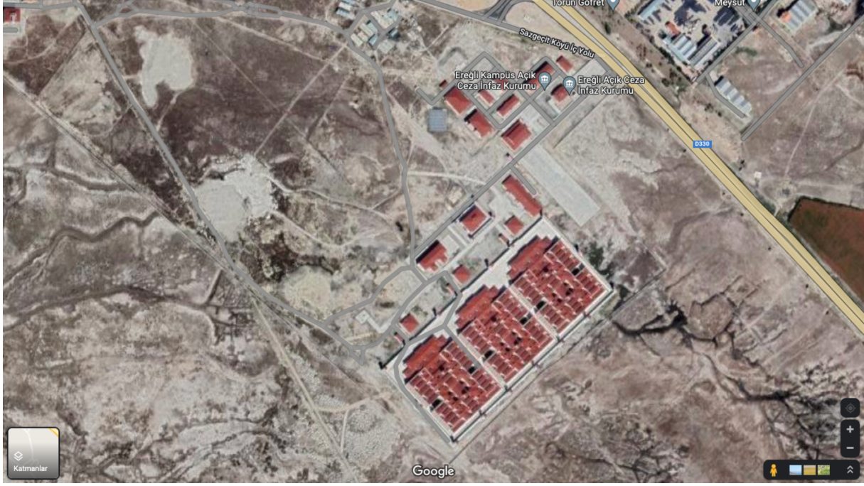
Ereğli Ceza İnfaz Kurumları Kampüsü

Ceza ve Tevkifevleri Genel Müdürlüğü'nün sitesinde yer alan bilgilere göre Çorlu ve Ereğli'deki Ceza İnfaz Kurumları Kampüsü'nde iki Y Tipi ve bir de Yüksek Güvenlikli hapisane bulunmaktadır. Ancak görsellerde bu hapisanelerin üçü de aynı gözükmektedir. Aynı gözükmesinin önemi şurada yatmaktadır ki, aynı mimaride Y Tipi hapisanelerin kapasitesi 1135'ken Yüksek Güvenlikli hapisanelerin kapasitesi ise sadece 487'dir. Bu farklılığın nereden kaynaklandığı, her iki tipte mahpus başına düşen metrekarenin ne kadar farklılık içerdiği şimdilik bir muammadır. 7