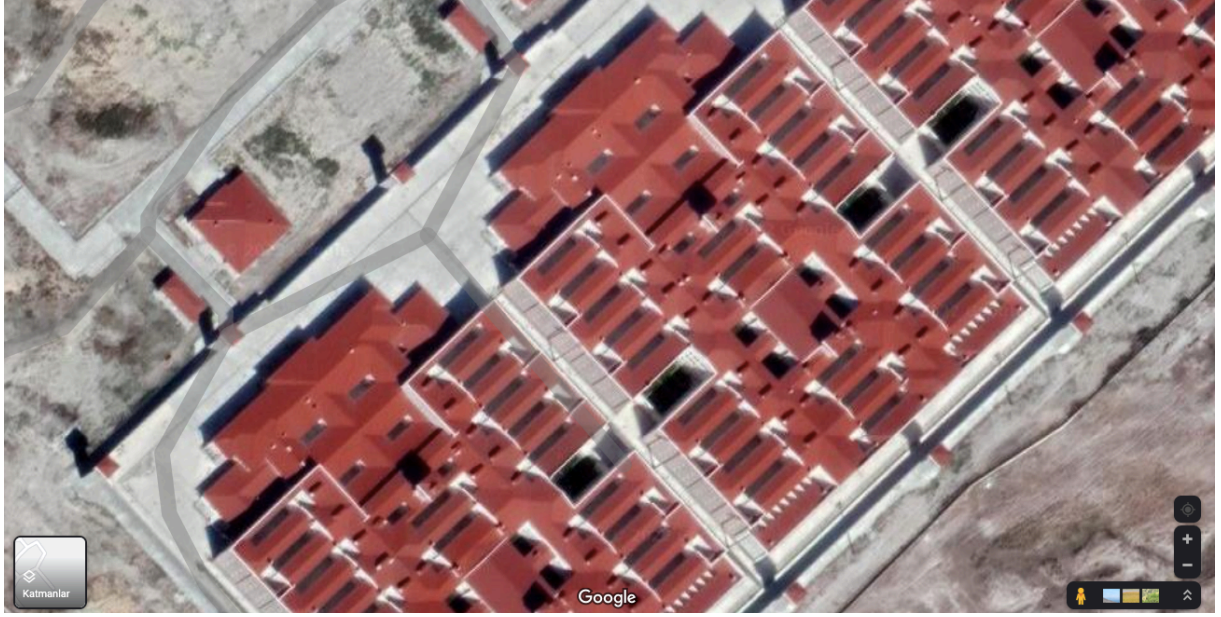
Ereğli 1 ve 2 No'lu Y Tipi Ceza İnfaz Kurumları