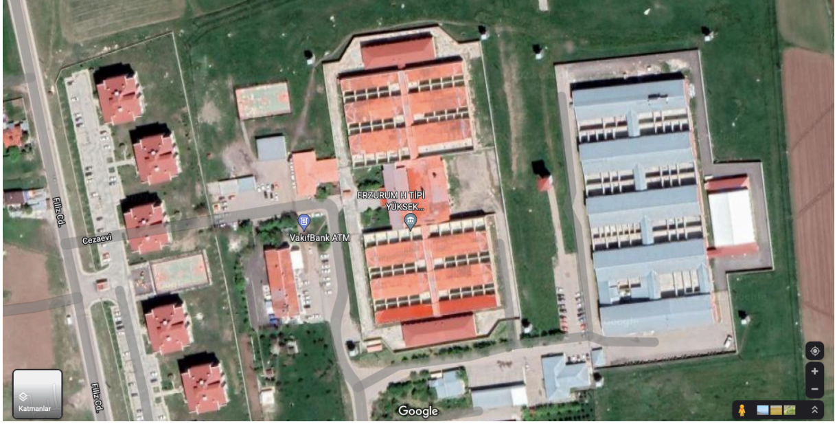
Erzurum H Tipi Yüksek Güvenlikli Kapalı Ceza İnfaz Kurumu